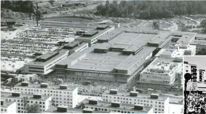
Tuntematon, Coggs bildbyrå U. Simonsson, Stadsmuséet i Stockholm