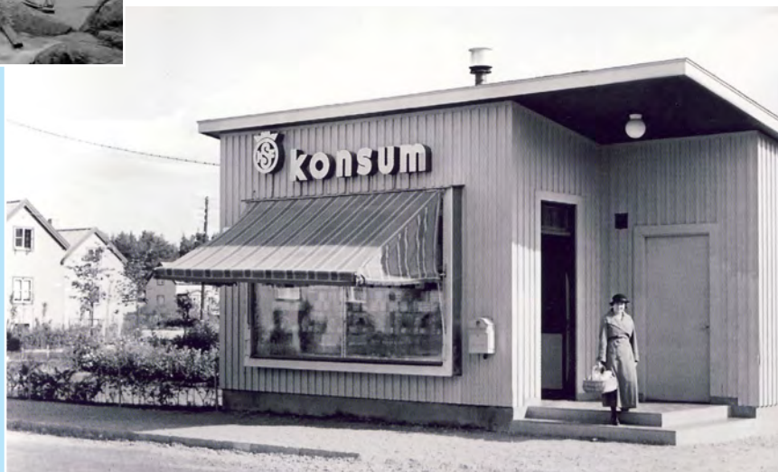
Tuntematon, KF's arkiv