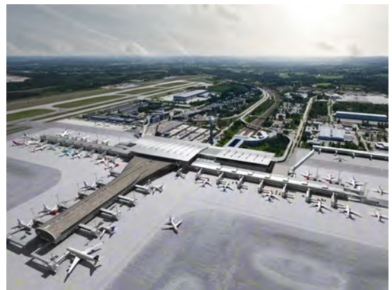
Nordic Office of Architecture

ORASin 700 työntekijää, kymmenen osastoa eri puolilla Norjaa sekä 1,2 miljardin Norjan kruunun liikevaihto tekivät Norjan Bravidasta nopeasti maan suurimman teknisten asennusten toimittajan. Yhdistyminen toi mahdollisuuden myös merkittäviin synergiaetuihin markkinoilla. Ennen kauppaa ORASin tulokset olivat olleet vähemmän hyviä, mutta pienillä ohjausliikkeillä ORASin käyttökate nousi pian samalle tasolle kuin Bravidalla. Uskomaton tulos.